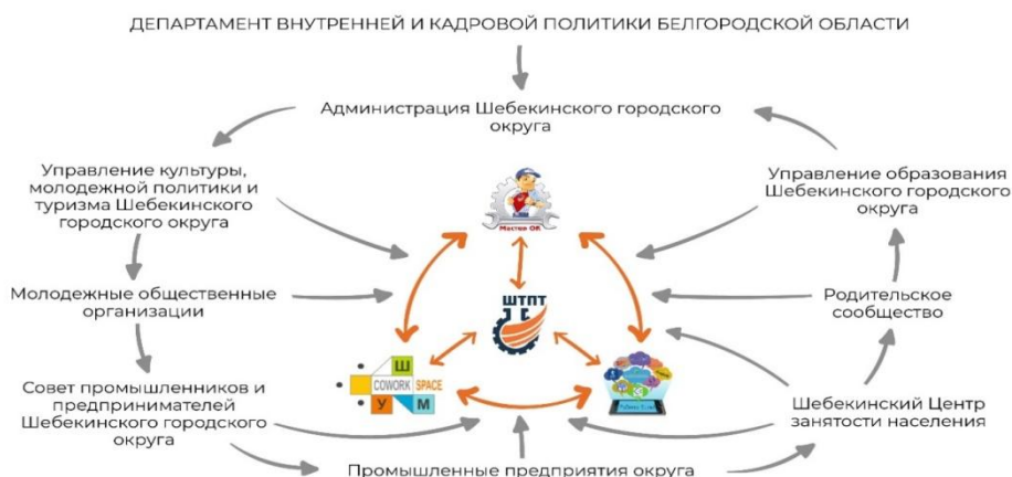
Схема 1.5.1. Механизмы отраслевого (или: отраслевого сетевого) взаимодействия (графическое изображение)