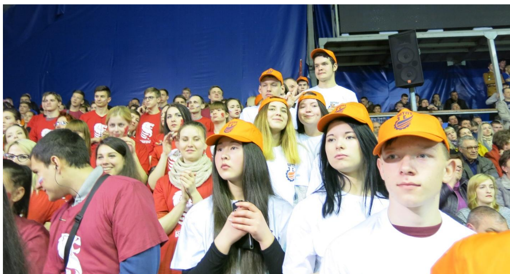
Наши студенты – болельщики